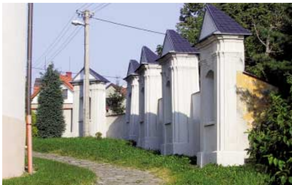
Před dokončením je i Křížová cesta u kostela sv. Jiří. Město na rekonstrukci v tomto roce přispělo 10 % potřebné částky.