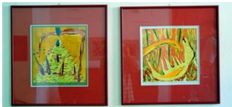
Na vernisáži 11. 7. 2002 v galerii Cha- vila se předsta- vila svými díly skupina A 13 z Krnova