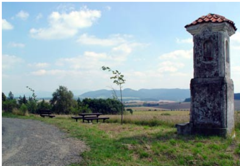
U kapličky sv. Marka je vystavěno posezení s překrásným výhledem na celé panoráma Beskyd