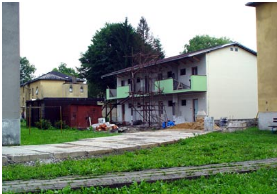
Byty v novém domě areálu obecních domů jsou těsně před dokončením, dokončují se i práce na ulici Jožky Matěje.