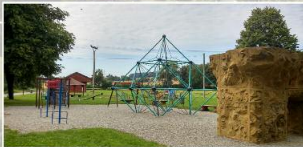
Sportovně-rekreační areál pro děti v blízkosti areálu Dobrovolných hasičů Brušperk