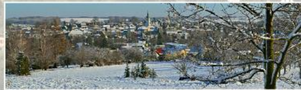
Zima v Brušperku