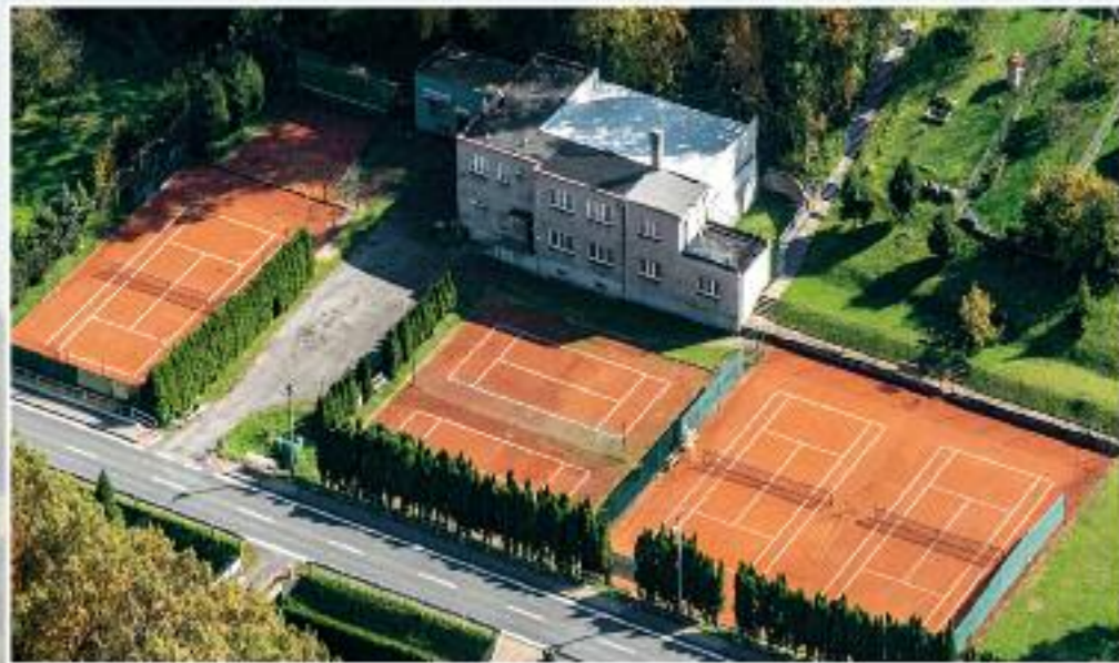
Sokolovna s tenisovými kurty Postavena podle návrhu Vladimíra Chamráda. Její výstavba začala v roce 1939, ale v důsledku války byla dokončena až v roce 1947. Brušperský Sokol byl založen v roce 1891 a patří k nejstarším spolkům ve městě.