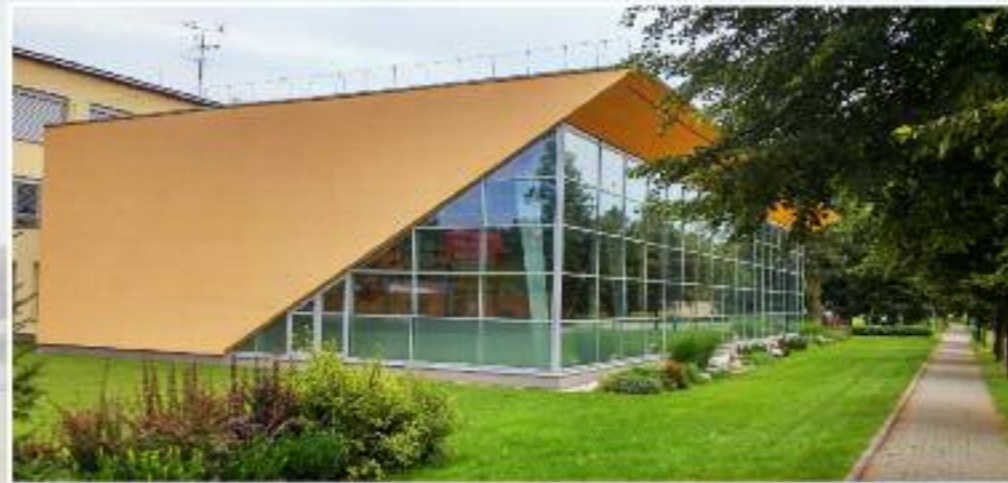
Krytý bazén Otevření krytého bazénu se konalo dne 5. září 2015. Bazén je určen pro rekreační, sportovní a výukové využití. Bazénová hala je navržena jako přístavba ke stávajícímu areálu školy.