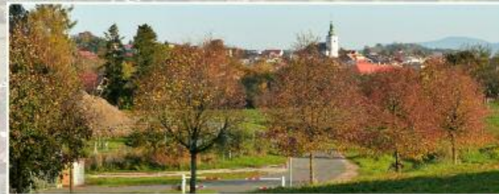
Cyklostezka od Staré Vsi nad Ondřejnicí