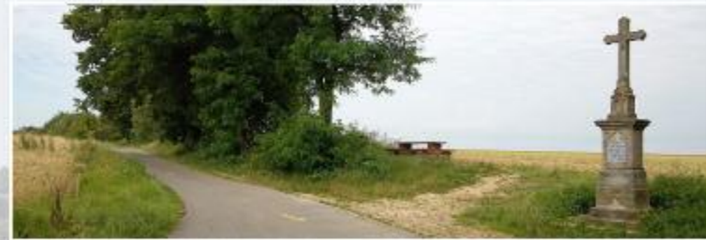
Cyklostezka u Obecního lesa – Lednického kříž