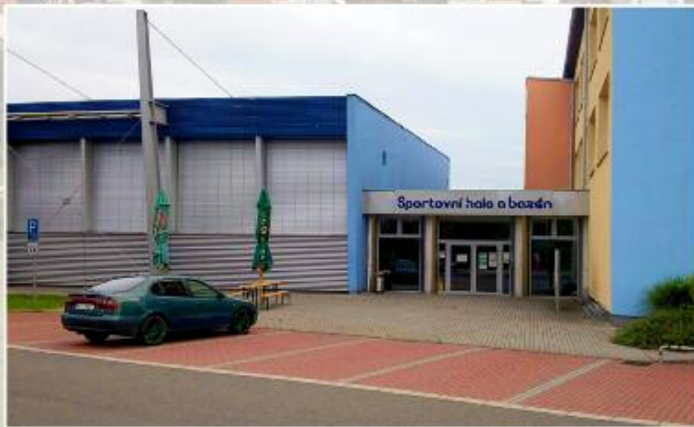
Sportovní hala Slavnostně otevřena dne 9. září 2006. Velikost haly umožňuje provozovat i sporty jako jsou košíková, mezinárodní házená, futsal, florbal, badminton, volejbal i na ligové úrovni.