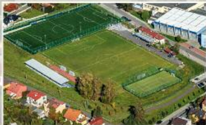
Stadion SK Brušperk