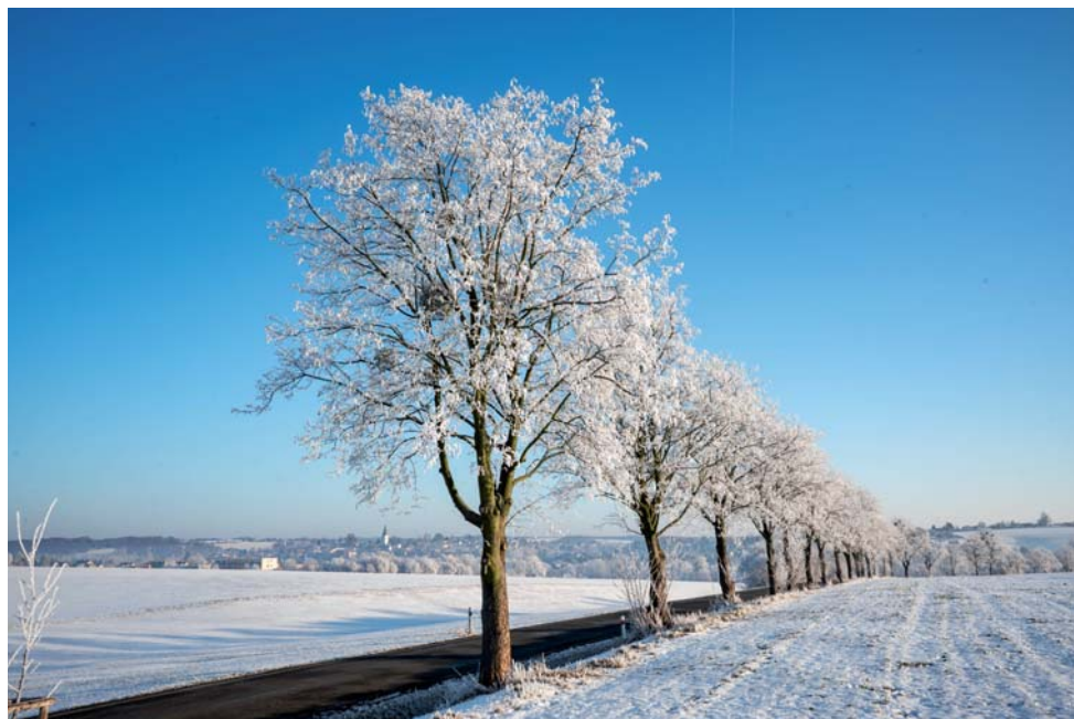
Z mrazivého rána v Brušperku dne 19. 1. 2026.