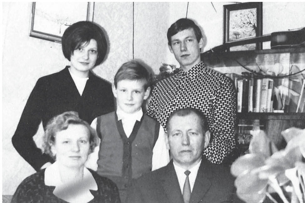
Rodinné foto z roku 1965.

Pracovala nějakou dobu v textilce ve Frýdku-Místku. Pak, nejdéle, ve vinařských závodech v Ostravě. Ráda chodila s manželem tančit. Cvičila v Sokole. Byla ráda mezi lidmi, chodila do svazu žen a svazu zahrádkářů. Bavila ji zahrádka a práce na poli. Také ji bavilo pletení a háčkování. Ve starším věku ráda četla, dívala se na televizi a luštila osmisměrky.