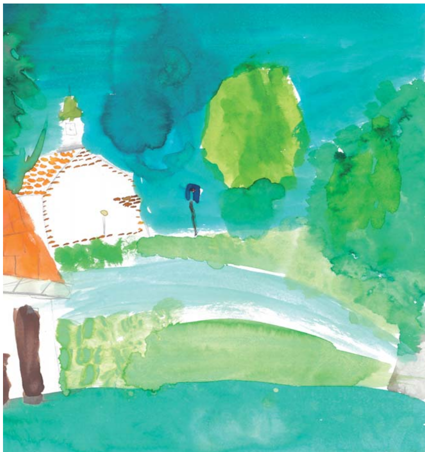
Brušperk očima mladé generace.

Tímto velice děkujeme paní knihovnici za skvělou přípravu programů pro děti, milý přístup, ochotu a nadšení, které dětem předává. Díky tomu jsou návštěvy knihovny pro děti krásným zážitkem.