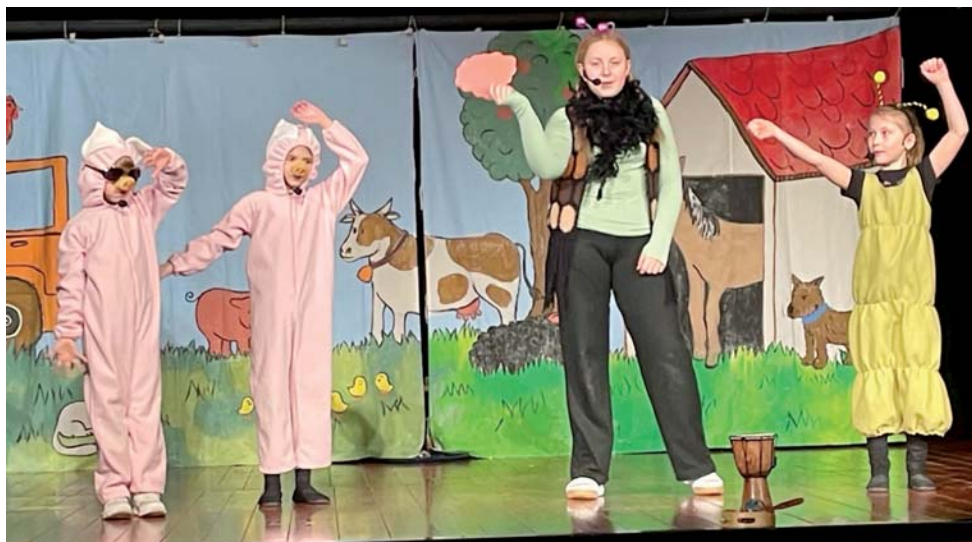
Brušperské hudební těleso BRUKULELE BAND

THE BOX – BEDNA ... O tom, co se stane, když rodiče nechají děti samotné doma. Můžete se těšit na scénky ze Simpsonů, Zootropolis, kuchařskou show, Slunce, seno... Určeno dětem od 9 let.