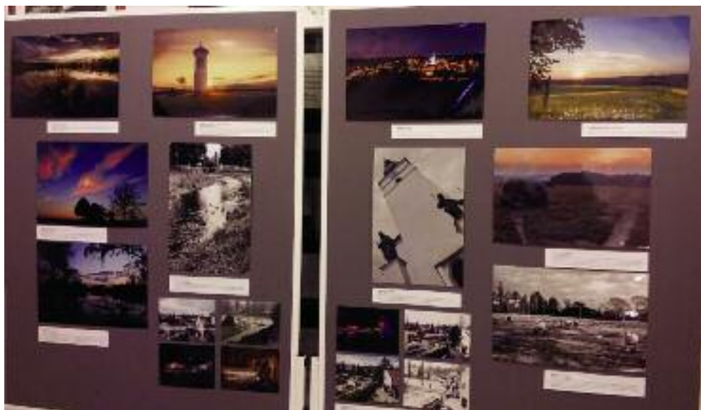
Z výstavy fotografií ze soutěže k 750. výročí města