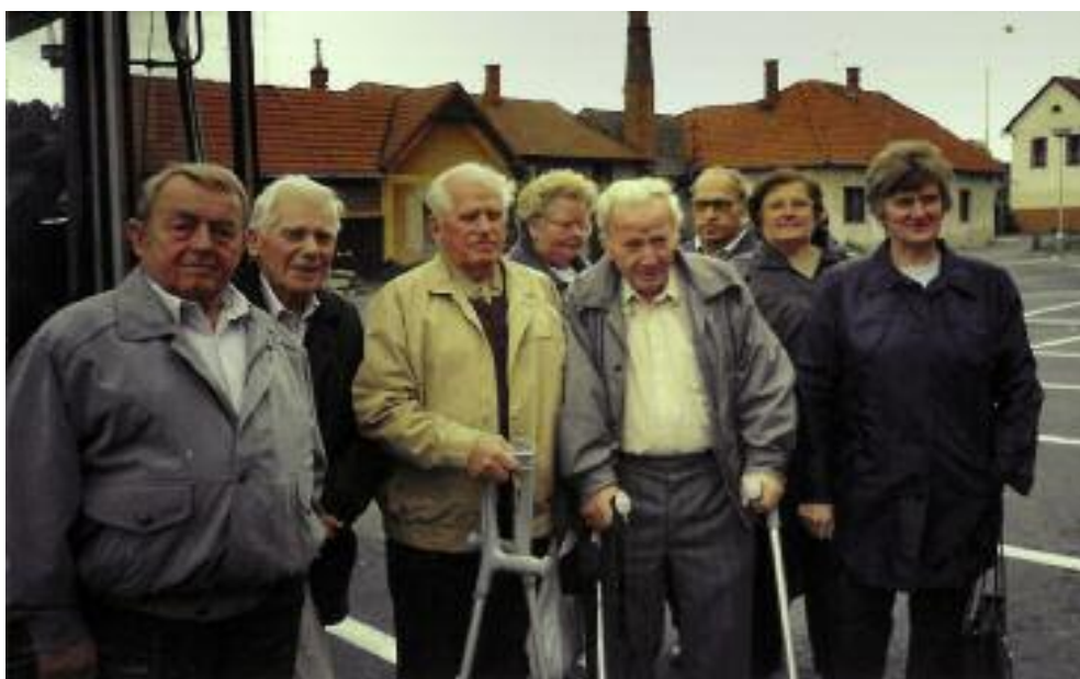
Členové SPCCCH Brušperk na zájezdě