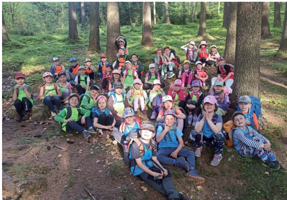
Děti z mateřské školy na škole v přírodě v Horní Bečvě.