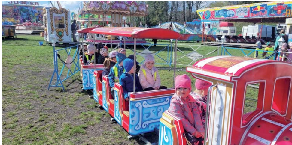
Děti z mateřské školy na pouti v Brušperku.