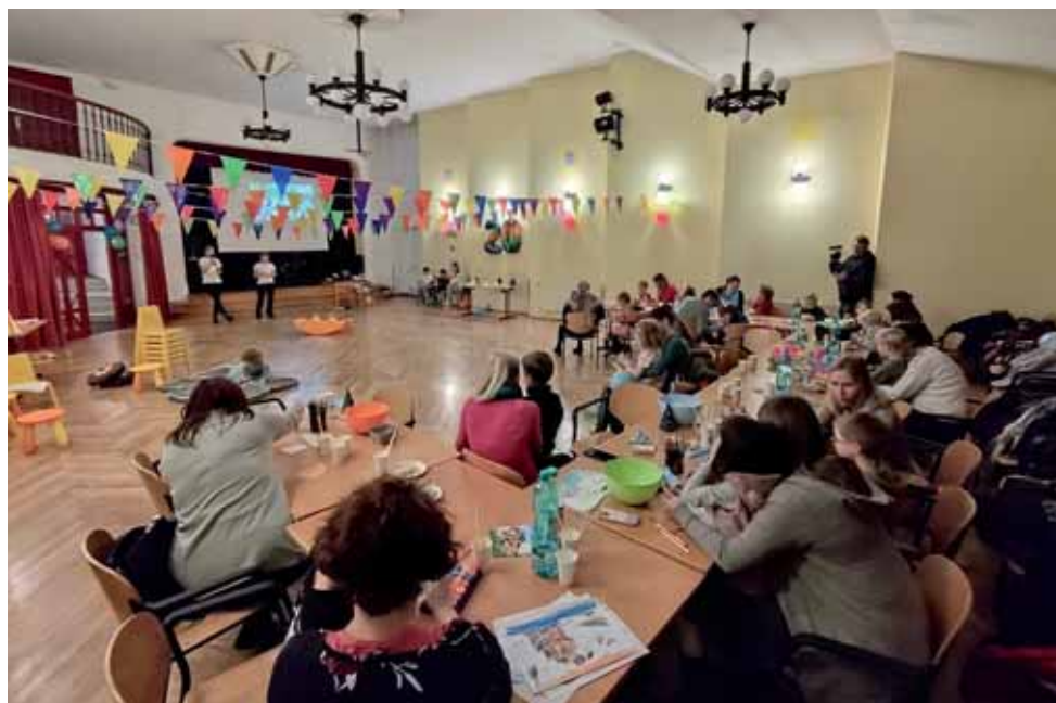
Oslava založení spolku Kuřátka Brušperk, z. s.