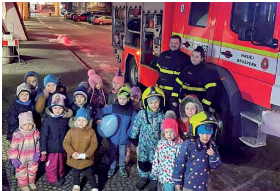
Oslava založení spolku Kuřátka Brušperk, z. s.