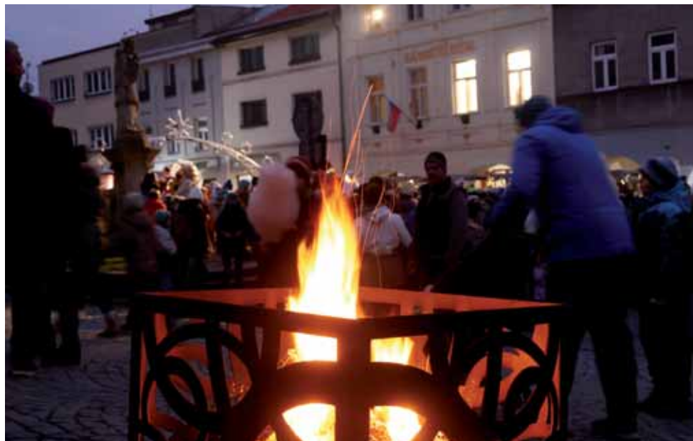
Rozsvícení vánočního stromu a Mikuláš na náměstí.