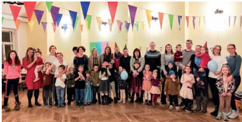
Oslava založení spolku Kuřátka Brušperk, z. s.