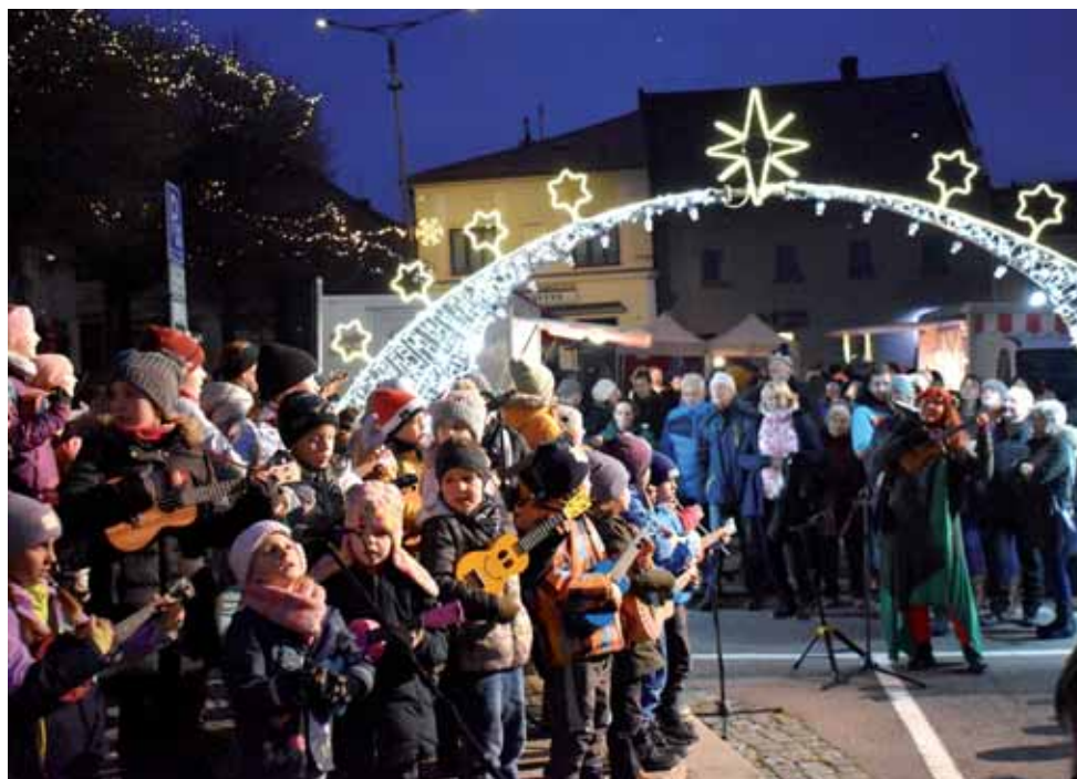
Brukulele band na rozsvícení vánočního stromu.