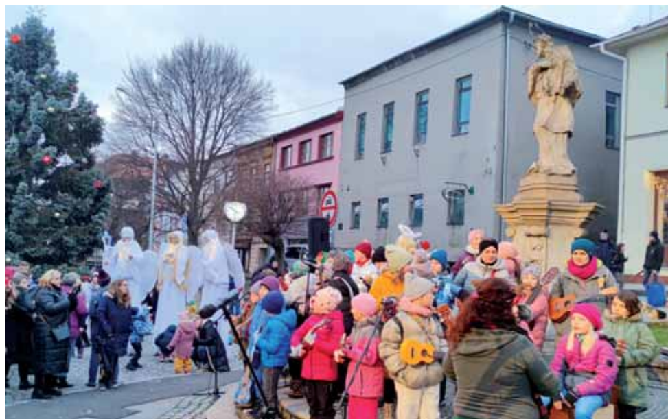
Brušperský advent na náměstí před rozsvícením vánočního stromu.