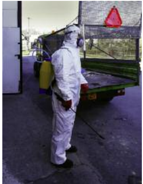
Provedena byla dezinfekce veřejných prostor.