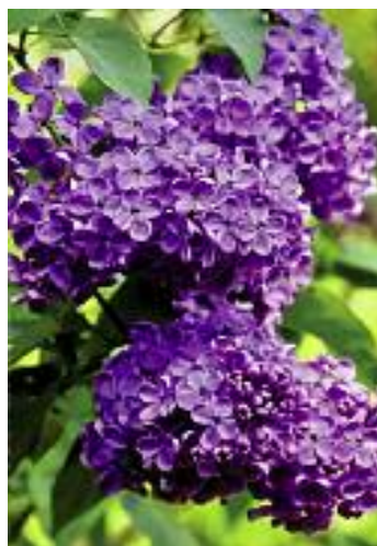
Brušperk v květnu Titulní strana

Díky básni Máj od K. H. Máchy je květen považován za měsíc lásky.