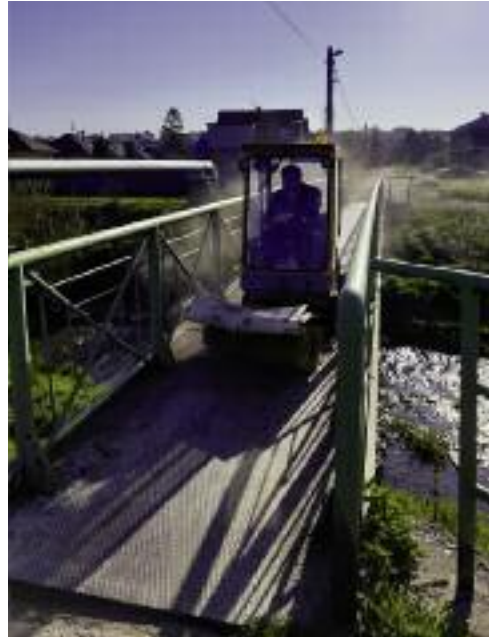
Proběhlo čištění městských komunikací a chodníků.