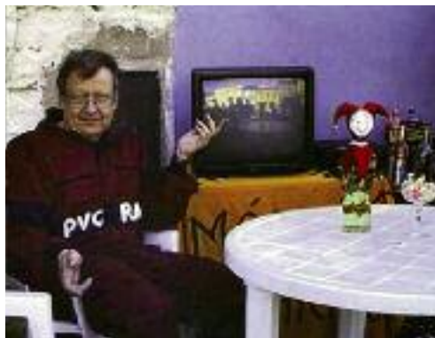
Foto: Karikatura MAWISáka a MAWISák o brušperské pouti