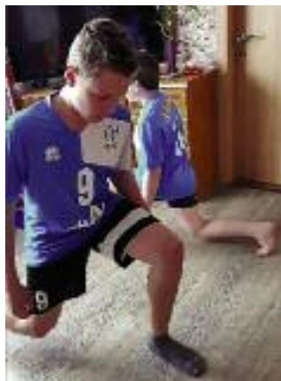
Chvostci druhý týden