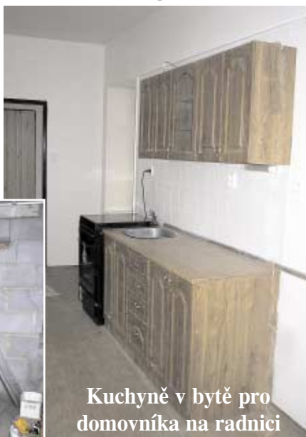
Kuchyně v bytě pro domovníka na radnici