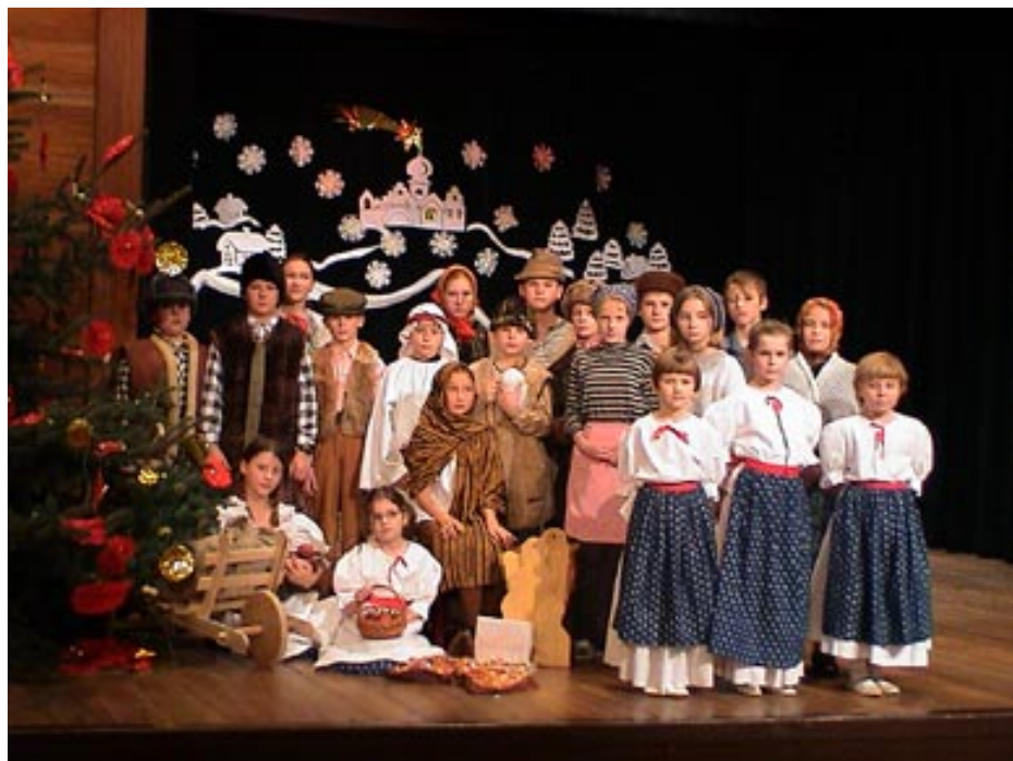
Princezna ze mlejna z roku 1997, režie V. Hajnošová a B. Vichrová.