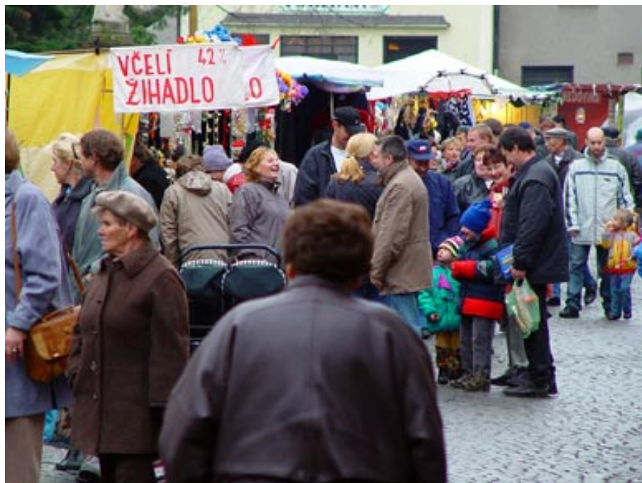
Dne 23. listopadu se konal ve městě za nepříznivého počasí tradiční Kateřinský jarmark.