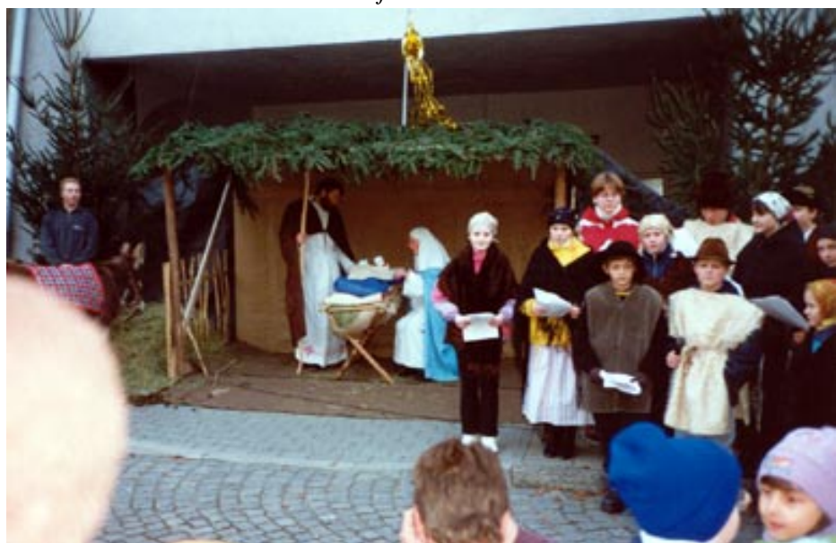
Živý betlém se těšil velké oblibě našich občanů.