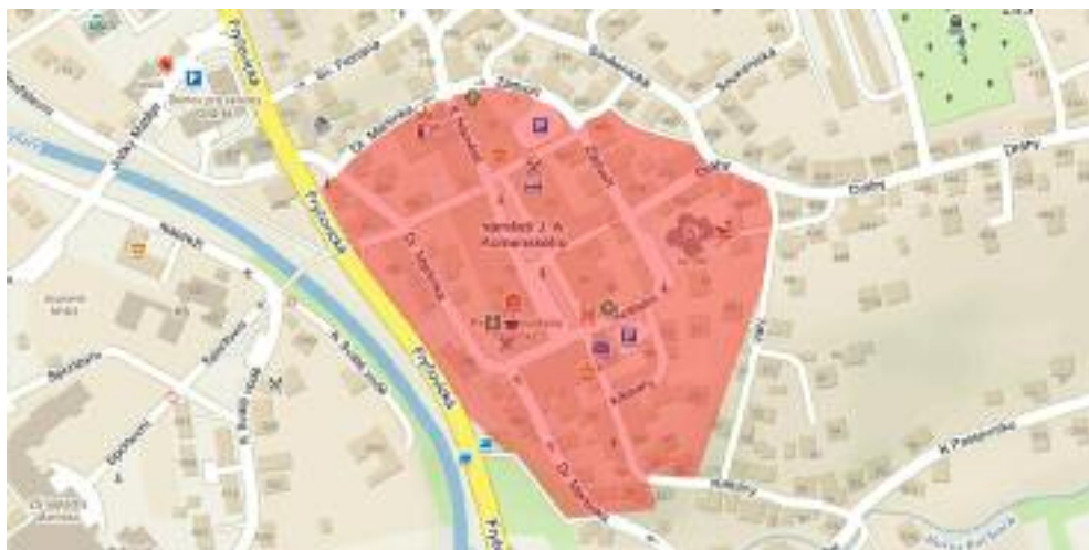
Historické jádro města (zvýrazněno na podkladu mapy.cz)