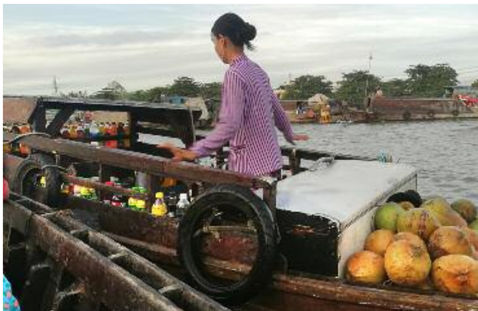
Mekong — prodej kokosových ořechů