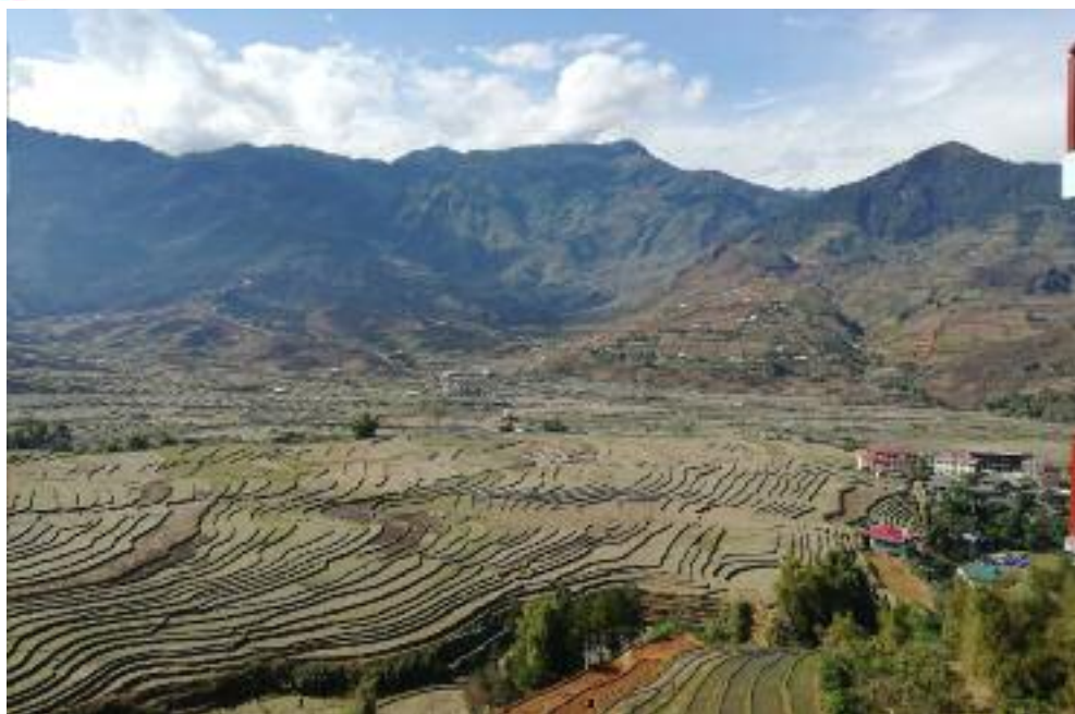
Sever Vietnamu — rýžové terasy