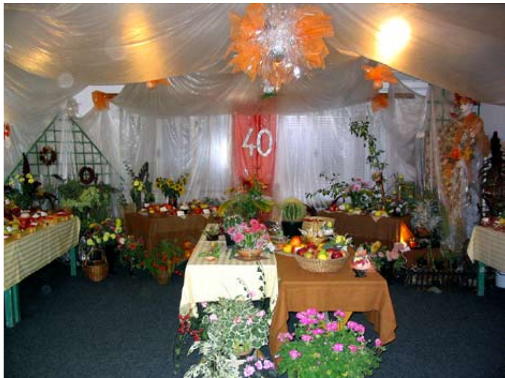
Z výstavy brušperských zahrádkářů, kteří si připomněli 40. výročí vzniku.